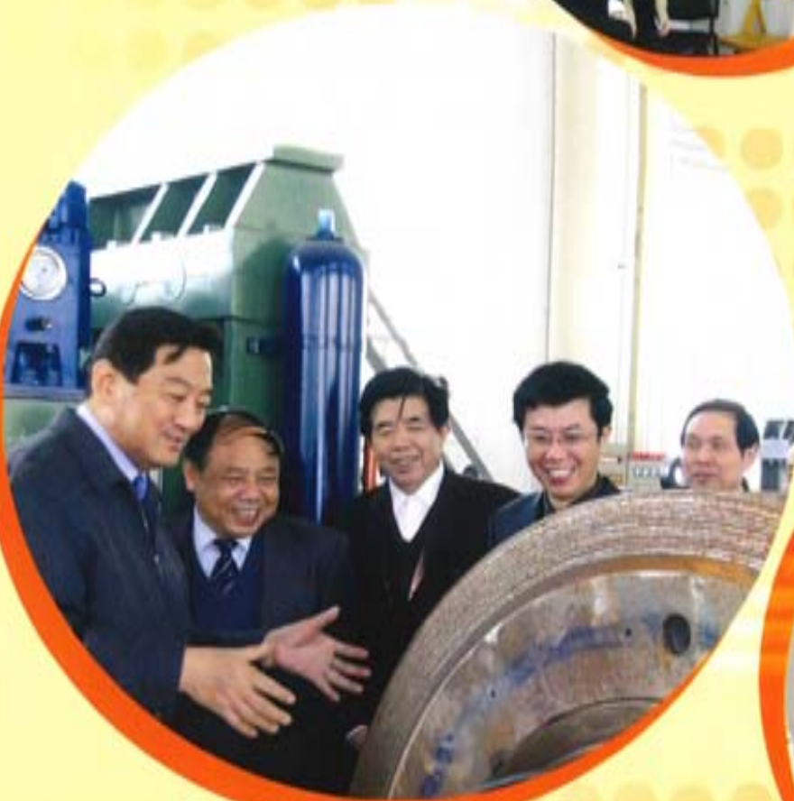
国务院参事室副主任蒋明麟视察合肥院