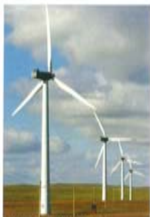
内蒙古辉腾锡勒风电厂