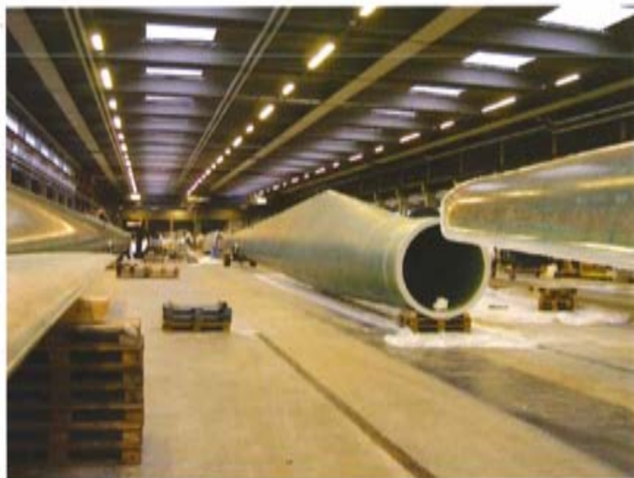
丹麦 Bonus 公司 叶片生产车间

北和西北的草原或戈壁，以及东部和东南沿海或岛屿。风力资源主要分布在两大风带，一是东南沿海、山东、辽宁沿海及其岛屿的沿海风带，二是内蒙古北部、甘肃、新疆北部及松花江下游的内陆风带。